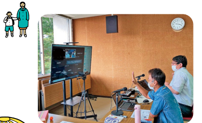
オンライン配信するスタッフ

広島県の教育支援センターの機能を強化した、新たな教育の場 SCHOOL“S”の開設から1年。今回は、これまでのSCHOOL“S”における活動の様子や、利用した児童生徒、保護者の思いを紹介します。