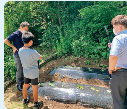
6月 さつまいもの苗植え