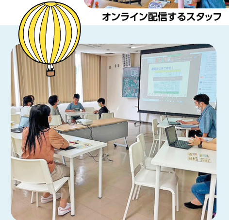
10月 開けよう!ミライのとびら ～進路座談会～