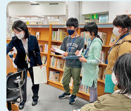
11月 図書委員会の活動