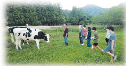
牛の糞かき・飼料づくり ニワトリのえさやり・用具洗浄