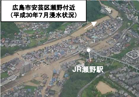
広島市安芸区瀬野付近 (平成30年7月浸水状況)