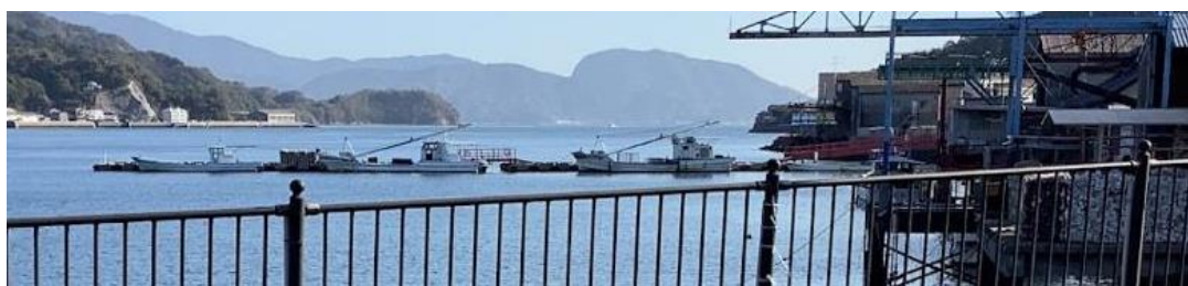
音戸の海から児童が確認した船の数々