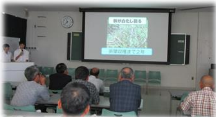
◇ R元年世羅高校生徒との意見交換 ◇

広島県指導農業士会では、研修の受入や農業高校等との意見交換、県内外の先進農家視察を行っています。