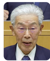
自民議連 やまきまさひろ 山崎正博 議員 (広島市安佐北区)