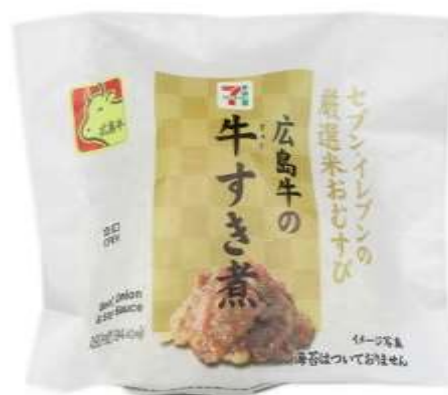
令和3年2月・5月に続き第3弾目！セブン・イレブンで広島牛！凄いですね。

お近くのセブン・イレブンで順次販売されるそうです。もし、見かけたらお手に取って見て、一度は購入してみたいはいかがでしょうか。価格は180円(税込194.4円)です。