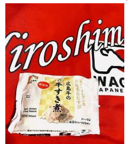
広島和牛Tシャツと一緒に「広島牛すき煮」撮影。Good!!