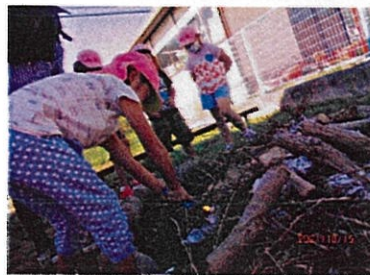
たき木集め・火をおこす