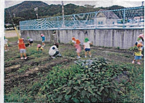
⇒ 草取り・水やり・支柱 添え木