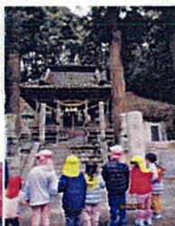
しゃくとり虫、 見つけ！