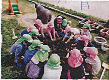
腐葉土を混ぜて土作り