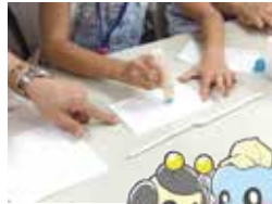
広島県浄化槽協会 マスコットキャラクター 「浄化ぞうくん」「はたる子ちゃん」