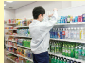
広島障害者職業能力開発校での訓練