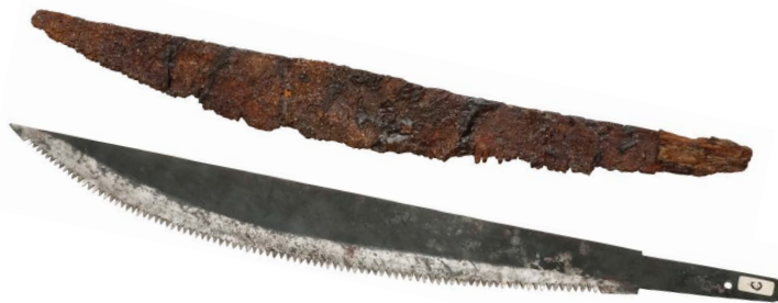
のこぎり 上 木の葉形鋸 (重要文化財 広島県草戸千軒町遺跡出土品) 下 木の葉形鋸復元品

木の板を人の形に削ったものだよ。 こんなふうにも、烏帽子(えぼし)を かぶった人の横顔なんだ。