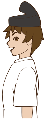
ひとがた 人形 (重要文化財 広島県草戸千軒町遺跡出土品)

昔もサイコロがあったんだね! 一辺7mmって、ちっさいなあ 何のゲームに使ってたのかな?