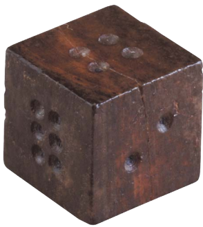
さいころ 賽子 (重要文化財 広島県草戸千軒町遺跡出土品)

昔もサイコロがあったんだね! 一辺7mmって、ちっさいなあ 何のゲームに使ってたのかな?