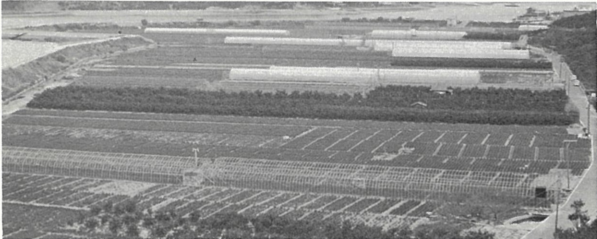
御調郡向島町におけるワケギ栽培