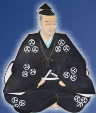
毛利元就肖像画 (安芸高田市歴史民俗博物館蔵)

広島県立図書館では、広島県文化芸術課並びに安芸高田市入城500年記念事業実行委員会と連携し、毛利元就の事績等を紹介した図書館資料を展示・貸出しし、関連するパネル展示を行います。