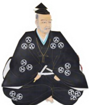
毛利元就肖像画 （安芸高田市歴史民俗博物館蔵）

今回の展示では、元就が活躍した戦国時代から、その後訪れる江戸時代に着目し、今に繋がる広島の礎を再発見していただけたらと思います。