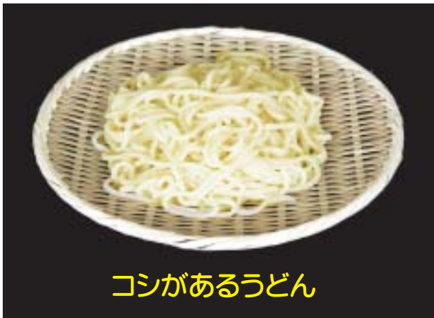
コシがあるうどん