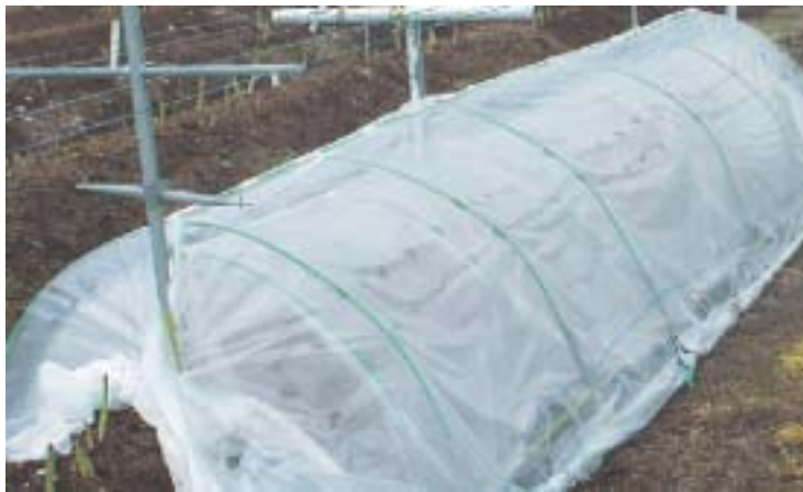
トンネルの設置状況

4月初旬（最低気温が -3^{\circ}\text{C} 以上になる時期）に、有孔POフィルムと不織布を用いた2重トンネルで被覆すると、収穫開始が早くなり、高価格が期待できる4月の収量が多くなります。