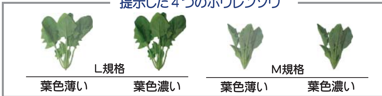
提示した4つのホウレンソウ

規格と葉色の異なる4つのホウレンソウ（L, M規格と葉色の濃淡）を消費者に提示した結果、消費者ニーズは3つのグループ（L規格が好みな人, M規格が好みな人, 葉色濃いのが好みな人）に分類されました。