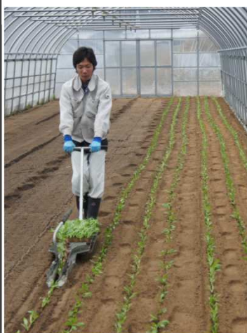
軟弱野菜の移植 (広島県)