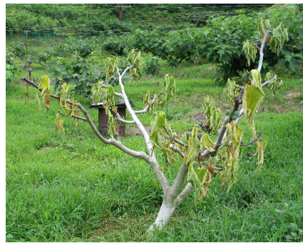
図1 株枯病により枯死したイチジク