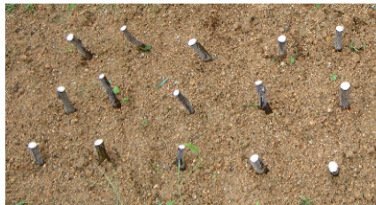
図2 現地圃場に枝を挿し込んだ状況