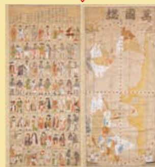
「万国総図・世界人物図」江戸時代前期 ※