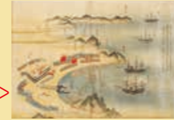
「亞米利加船来航図」江戸時代末期 ※