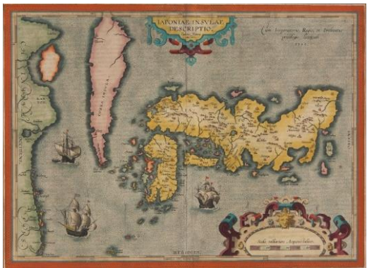
写真 テイセラ/オルテリウス「日本図」