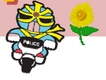
広島県内の二輪車の死者数【平成25年～令和5年6月現在】