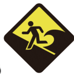
津波がくるところ