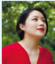
犬山 紙子 イラストエッセイスト