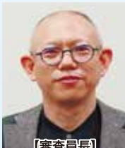
【審査員長】 上水流 久彦 県立広島大学教授