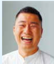
中島 尚樹 タレント