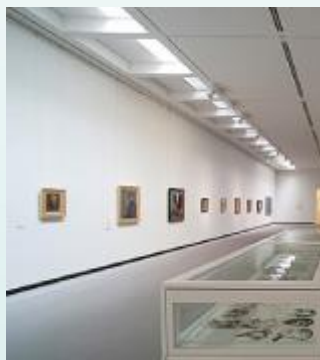
【照明のLED化】 美術館等県有施設の照明のLED化