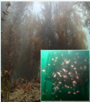
【漁場環境の保全】 瀬戸内海域における良好な漁場環境の創出