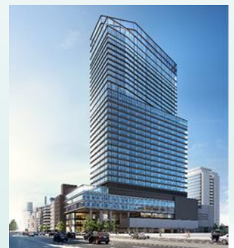
【市街地再開発事業】 脱炭素化に向けたサステナブルな都市再生