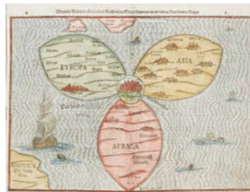
「クローバー型世界地図」ビュンティンク 1584年