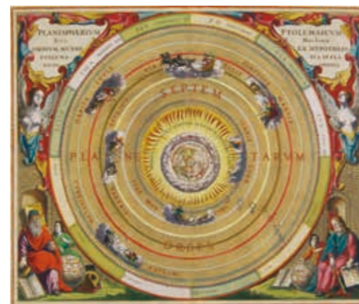
「プトレマイオスの太陽系図」セラリウス 1661年