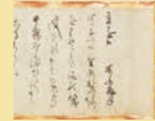
「東紀行」鳥丸光広 江戸時代前期 ※