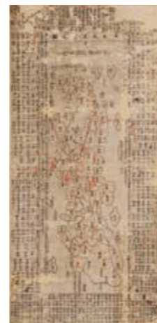
「日本扶桑国之図」 室町時代