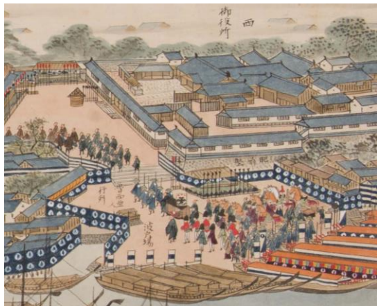
「文化元年魯人長崎渡来図」(部分) 江戸時代末期、当館寄託