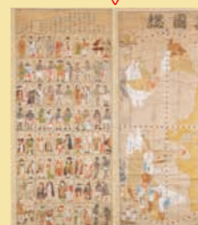
「万国総図・世界人物図」江戸時代前期 ※