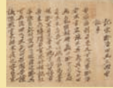
「記宋鄒浩田画王回曾誕生」吉田松陰 安政6年(1859) ※