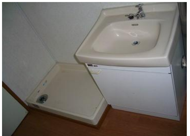
洗濯パン・洗面台