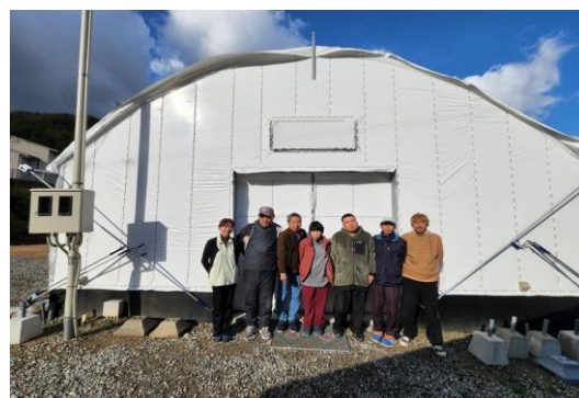
知的・精神障害者の方々と栽培しています。