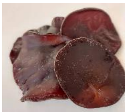
純国産 アラゲキクラゲ