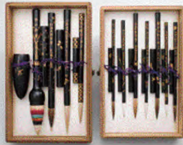
仿古本朝名人用筆乾・坤

昔ながらの熊野の民家で、筆司による筆づくりの実演を交え、筆ができるまでの工程を紹介しています。