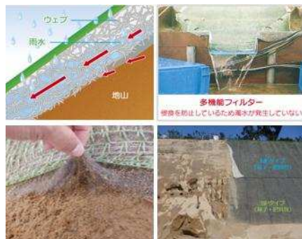
MFタイプ（種子・肥料有り、土壌改良材無し） 断面図／切土