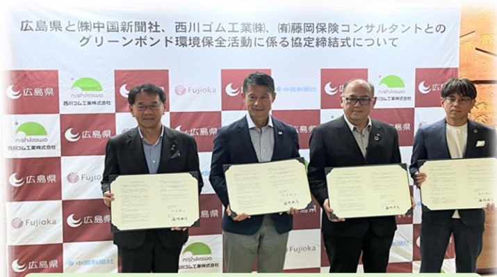
グリーンボンド環境保全活動に係る協定締結式