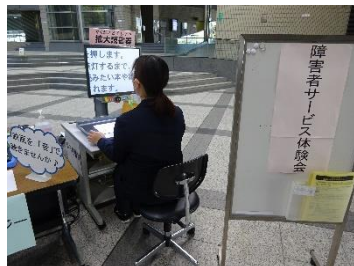
拡大読書器による図書の閲覧