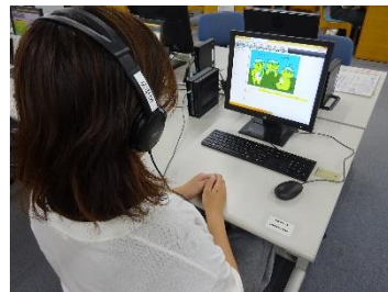
さまざまな資料の閲覧・貸出