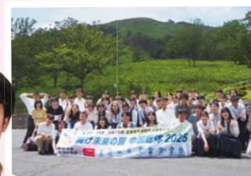
登山競技開催予定地 安芸太田町 深入山の麓で

「笑顔と楽しさを広めるけん 中国総体」のコンセプトのもと、広報の力で記憶に残る情報を発信し、観客席を埋めつくすことを目標に活動しています。それぞれの得意分野を活かし、広島県と全国の人々をつなぐ架け橋になりたいです。