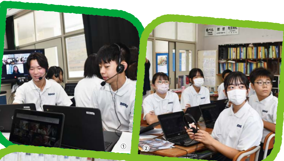
①② 韓国の中学生とオンライン英会話 (本郷中学校)