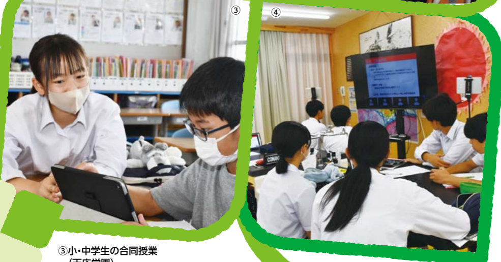
③ 小・中学生の合同授業 (天応学園)