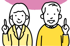
学校運営協議会の委員の皆さん

三次町と自分との関わり？ 魅力発信の企画？ それだったら、講師には こんな人がいいね!