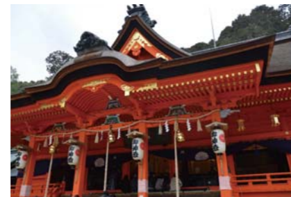
修理が完成した吉備津神社本殿(重要文化財)

地元では「いっきゅうさん」と呼ばれる備後一宮 吉備津神社(福山市)は、大同元年(806)に創建されたと伝わる古社です。令和4年、重要文化財本殿が保存修理を終えました。本展では、吉備津神社に伝えられた文化財を中心に、関連資料を展示するとともに、保存修理についても紹介します。