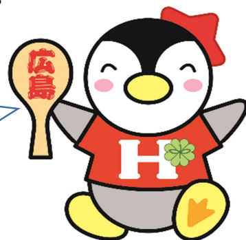
広島県民生委員児童委員協議会 マスコットキャラクター『広島県版 ミンジー』

民生委員児童委員について詳しく知りたい場合は、お住まいの地域の市役所や町役場の福祉窓口にお問い合わせください。