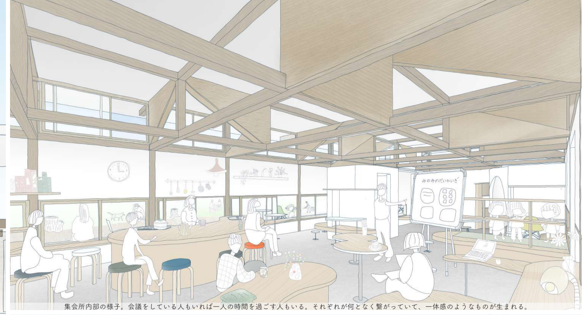
集会所内部の様子。会議をしている人もいれば一人の時間を過ごす人もいる。それぞれが何となく繋がって、一体感のようなものが生まれる。