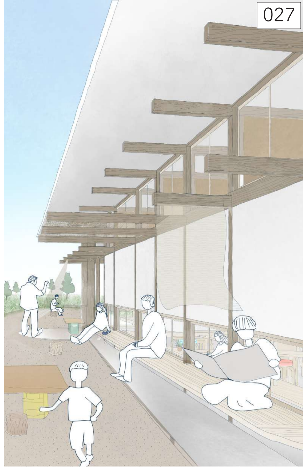
細長い縁側の様子。すだれを自由に掛けて緩やかに区切り区切らなかつたり。