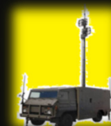
自衛隊車両 12月2・3日