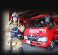
消防署車両 12月2・3日