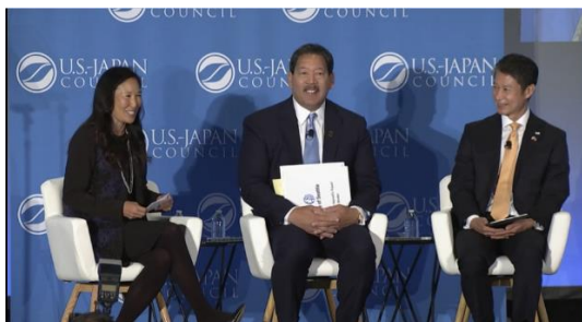
シアトル市長との対談

日米政財界のトップ層や現地企業など、総会参加者約 600 名に対して、G7 広島サミットの成果として、平和のメッセージの発信、広島の認知度の向上、若い世代の参加という 3 つの目的を達成したことを PR するとともに、シアトル市長との対談を通じて、地域から行う外交の重要性について認識を共有した。