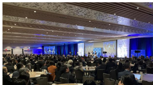
米日カウンシル年次総会会場