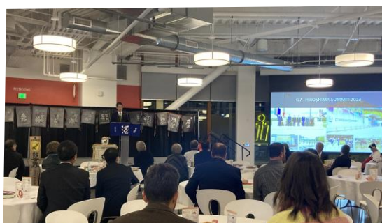
対日投資・日本酒 PR イベントの様子

アイダホ州の上院議員、政府関係者、教育機関関係者、民間企業関係者約 50 名に対して、広島県への投資誘致を PR する有意義な機会となったほか、東広島市とともに、多くの雇用と巨額の投資を行うマイクロンを共有するアイダホ州やボイジー市と課題共有や連携関係を構築する基礎ができた。また、イベントでは、広島県産の日本酒のテイastingとともに、日本酒の製造工程や味わいの違いの紹介を行い、参加者に広島の日本酒についての理解を深めていただいた。