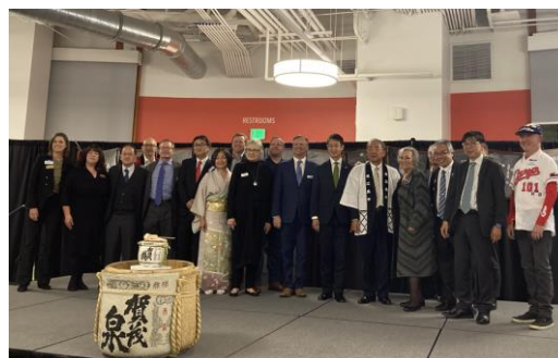
主催者及び参加者との記念撮影