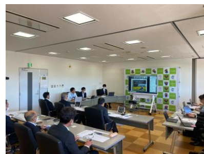
<北広島町長へのプレゼン>