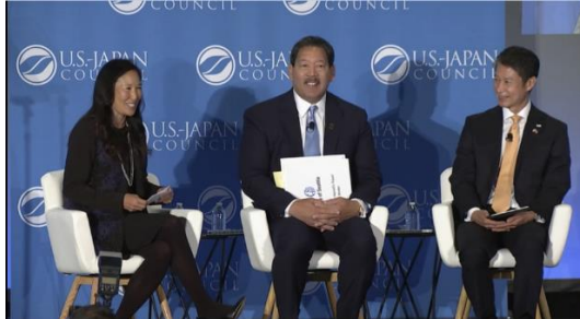
シアトル市長との対談

日米政財界のトップ層や現地企業など、総会参加者約 600 名に対して、G7 広島サミットの成果として、平和のメッセージの発信、広島の認知度の向上、若い世代の参加という 3 つの目的を達成したことを PR するとともに、シアトル市長との対談を通じて、地域から行う外交の重要性について認識を共有した。