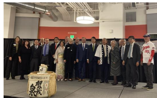
主催者及び参加者との記念撮影