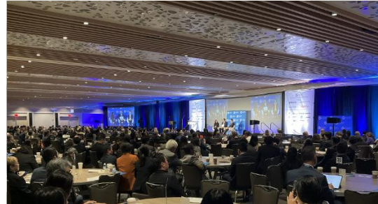
米日カウンシル年次総会会場