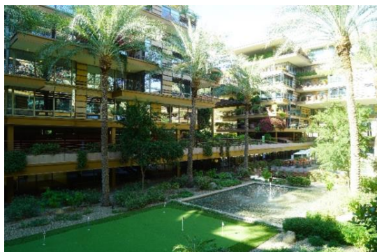
スコッツデールの集合住宅

エンジニアや大学教授などの高度人材が暮らす地域の都市機能や住居の水準について、東広島市や広島大学スマートシティコンソーシアムの方々としっかりと共有することができ、今後の広島大学周辺における「グローバルスタンダードな居住環境の創出」に繋がる機会となった。