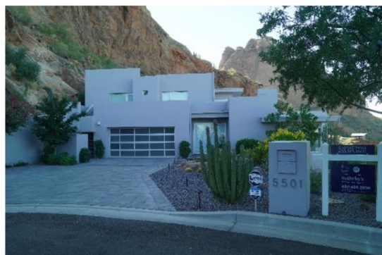
パラダイスパレーの戸建住宅