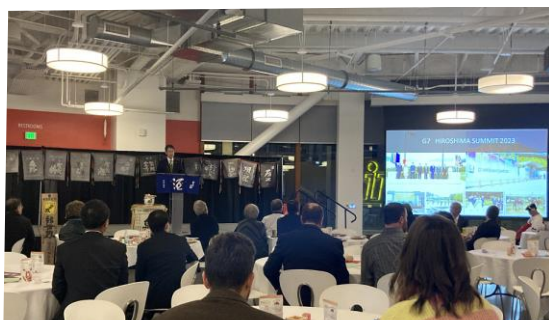
対日投資・日本酒 PR イベントの様子

アイダホ州の上院議員、政府関係者、教育機関関係者、民間企業関係者約 50 名に対して、広島県への投資誘致を PR する有意義な機会となったほか、東広島市とともに、多くの雇用と巨額の投資を行うマイクロンを共有するアイダホ州やボイジー市と課題共有や連携関係を構築する基礎ができた。また、イベントでは、広島県産の日本酒のテイastingとともに、日本酒の製造工程や味わいの違いの紹介を行い、参加者に広島の日本酒についての理解を深めていただいた。