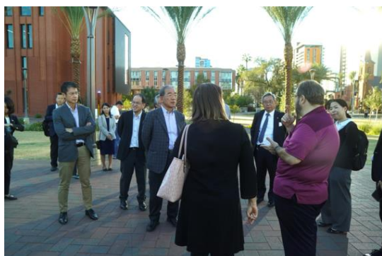
アリゾナ州立大学の視察