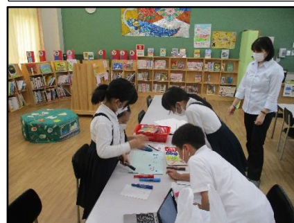
図書館を活動場所として選択し学習するグループ(図書を活用)

授業の開始時に、めあてや取り組むことをグループで話し合させた。自分たちのしたいことを実現させるために、どのようなことが必要なかをグループ内で共有する時間を設けることで、友達の意見を聞く機会が増え、友達の考えを受け入れる児童の姿が見られた。また、活動の仕方や方法、活動場所等をいくつかの中から選ばせた。グループ内での役割分担を行ったり、図書館や屋外での活動を自ら選んだりすることで、課題の解決に向けて、目的をもって学習に取り組もうとしている姿が見られた。