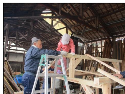
地域の方の協力のもと活動する児童の姿(ハウスづくり)

児童は、福富町で林業を営む方や、水生生物の保護活動を行う方、福富町の自然をフィールドとし研究をされている方など、自分のもち味を生かした仕事や活動をしている方とともに活動を行った。知識や技術の習得に限らず、疑問に思ったことを質問するなど、課題の解決に向けて、目的をもって学習に取り組んだ。