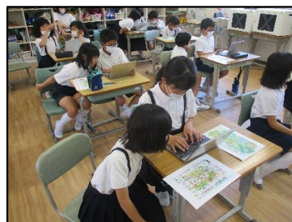
「里山」についての資料をもとに取り組みたいことを考える児童の姿

今年度は、昨年度に行ってきた福富町の自然を守るための取組と、「里山」というキーワードとの関わりの深さを確認することから学習をスタートさせた。自分たちの町や、町の自然に対する思いの強さはあっても、それをどのように実現していくかを具体化することが難しい児童にとって、「里山」についての資料をもとに考えたことで、取り組みたいことを考える際の選択肢が増え、児童が本当にしたいことを選択することができた。