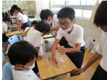
自分達で採集した8種類のカニ(チゴガニ・コメツキガニ・ハクセンシオマネキ・ヒライソガニ・ケフサイソガニ・イソガニ・イシガニ・マメコブシガニ)