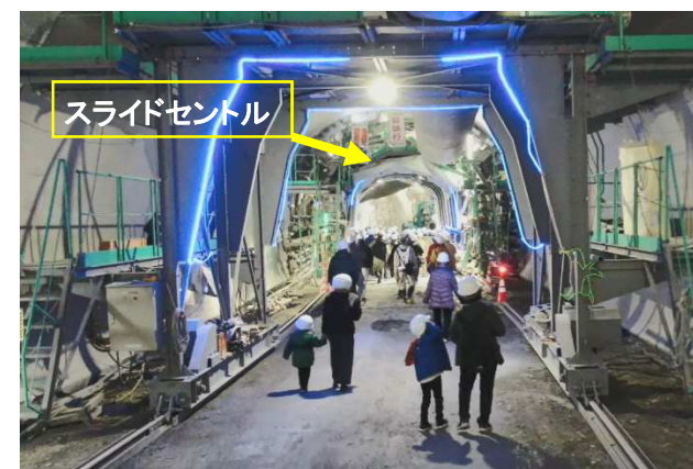
スライドセントル