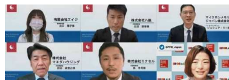
過去の受賞式の様子