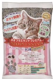
猫トイレ用砂「Neo Plus Sand プレミアム」

【事業者名】株式会社plus 【活用した制度】依、指 【利用したセンター】東部工業技術センター