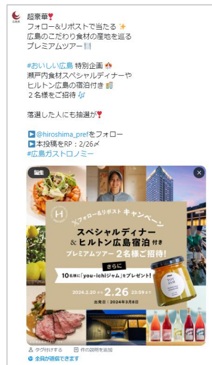
▶ 広島県公式 X キャンペーン対象ポスト