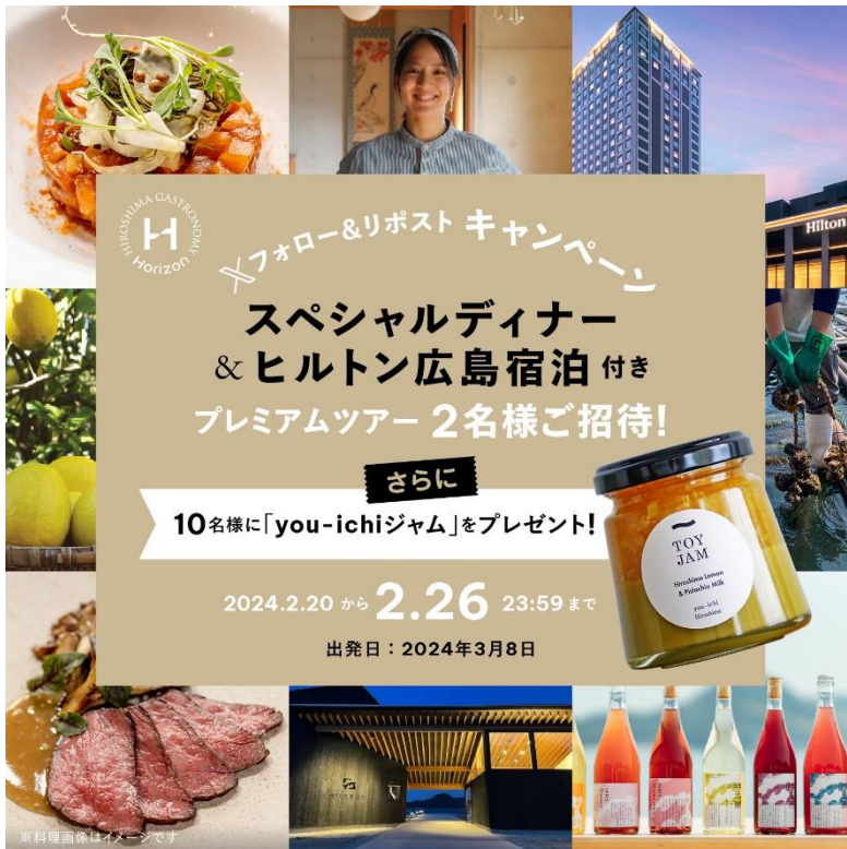
▶ キャンペーン画像

※本ツアーは広島空港集合・ヒルトン広島（広島市内）解散です。往復の交通費は自己負担となります。