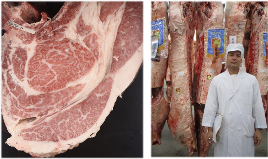
写真上段左： 最優秀賞を受賞した枝肉写真 各部位の充実が伺えます！ 上段右：受賞枝肉と 栴のば牧場さん 写真下段：褒賞授与式の様子