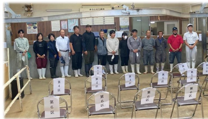
（県最終選抜会）閉会式的一幕。