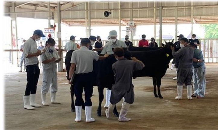
（県最終選抜会）個体審査の様子。