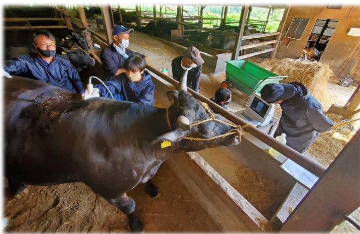
（肉牛の部）巡回審査の様子。

また、肉牛の部については、7月13日（水）から7月22日（金）にかけて巡回調査を行い、8月9日（火）に代表牛7頭を決定しました。