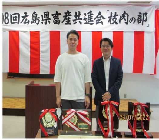
【第98回夏季枝肉の部優秀賞牛及びMUFA賞受賞牛】

令和4年7月26日(火)、広島市食肉市場において、第98回広島県畜産共進会「夏季枝肉の部」が開催されました。