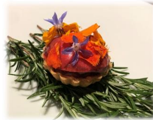
フレンチストゥ ソンスクレ