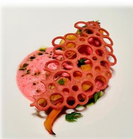
フレンチレストラン ソンスクレ