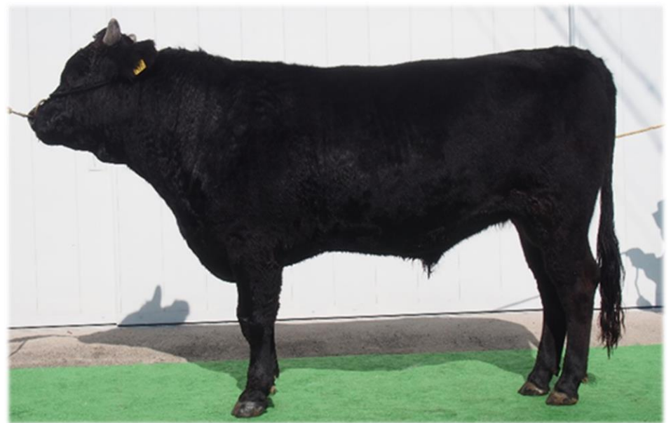
※選抜に伴い、R5年2月から1,573円/本に変更します。

肉質能力、増体能力ともに優れた波系の血統であることから、増体系（気高系、糸系）及び肉質系（土井系）との系統間交配が推奨されます。