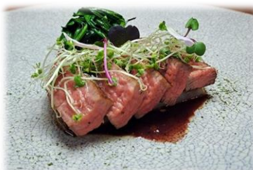
イタリア料理 La Sette