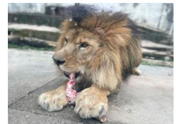
動物園ヘジビエを提供