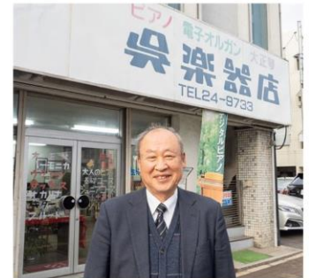
後継者募集中の呉楽器店

■鳥獣被害対策で処理にコストがかかっていた年間千頭にも及ぶ獣肉を、動物園のお気に入り動物へ贈る『推し活』に有効活用して猟友会の活動費を確保する取組（竹原市）