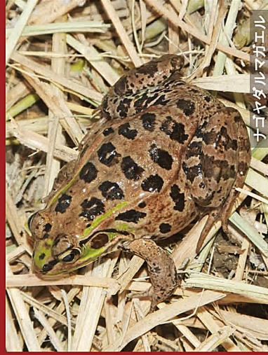
ナゴヤダルマガエル