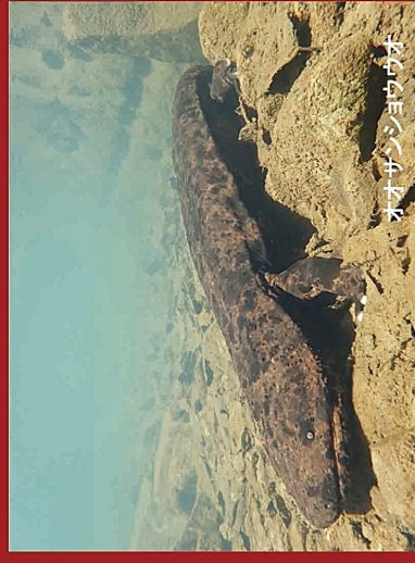
オオサンショウウオ