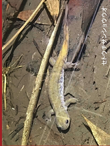
セトウチサンショウウオ