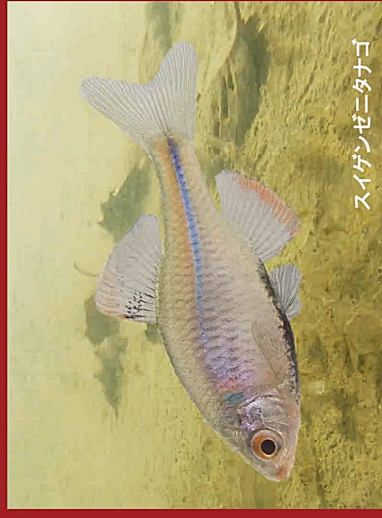
スイゲンゼニタナゴ