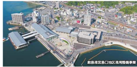
広島港宮島口地区港湾整備事業

県民の皆様の安全・安心を確保するための治水・高潮対策や土砂災害対策等を推進するとともに、社会経済活動の維持・発展に向けた、広域的な道路ネットワークの構築や広島港・福山港における港湾機能強化、広島空港の利用促進等に取り組んでいます。また、安心して便利・快適に暮らすことができる持続可能なまちづくりに向けた様々な取組を行っています。