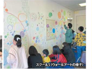
スクールS（ウォールアートの様子）