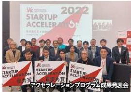
スタートアップ加速プログラム成果発表会

社会に大きなインパクトを与えるユニコーン企業を10年間で10社生み出すことを目指して「ひろしまユニコーン10」プロジェクトを推進しています。スタートアップ企業に伴走しながら資金調達の手助けを設けたり、海外進出の足掛かりを築いたりと事業の進捗に応じたサポートを行うことで、企業の挑戦を成長へとつなげていきます。