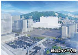
新病院イメージ図

県立広島病院、JR広島病院、中電病院の3病院を中心に多くの医療資源を集約し、高度な医療や様々な症例が集積された新病院を整備することにより、全国から意欲ある若手医師を惹き寄せ、患者の状態に応じた切れ目のない医療を地域の医療機関と連携して提供する地域完結型医療を実現するとともに、県内で従事する医療人材の地域への派遣・循環体制を構築することを目指しています。