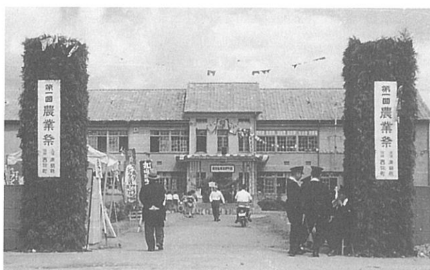
昭和31年 第1回農業祭

総合実験室新築149.5坪 網室新築50坪 堆肥舎新築28.5坪 車庫新築9坪 日本間改造 農夫舎移築等