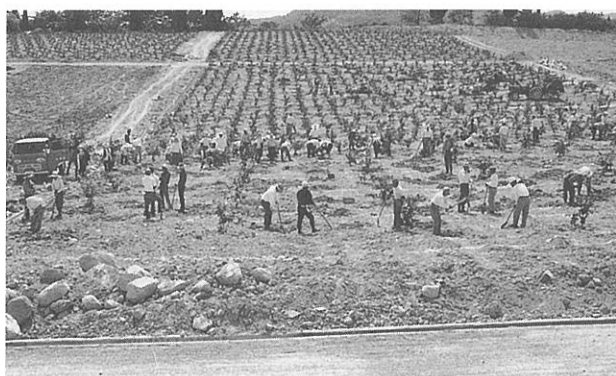
果樹試験場圃場植付風景

昭和42年には園地造成、土壤改良、農道、貯水池の造成、苗木の植栽が始まり、昭和43年には本館及び附属建物（現業舎、農具舎等）の建設、かん水及び防除施設の設置、砂防堰堤工事、果樹棚の設置工事が始まった。当時の研究機関設置基準では建坪が少ないため、農林省助成の農民センターを併設して面積を確保した。建物面積は15棟で3400m 2 、事業費約260,000千円を投じ、昭和44年11月7日に落成式が行われた。