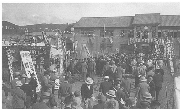
昭和36年 第6回農業祭