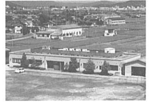
広島県農業ジーンバンク