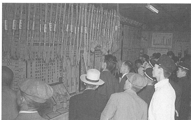
昭和32年 第2回農業祭

吉舎支場は昭和25年以来原種圃の業務のみを行ってきたが、地元の強い要望により、昭和31年から酒米及び白葉枯病の試験を開始して、試験研究が復活した。