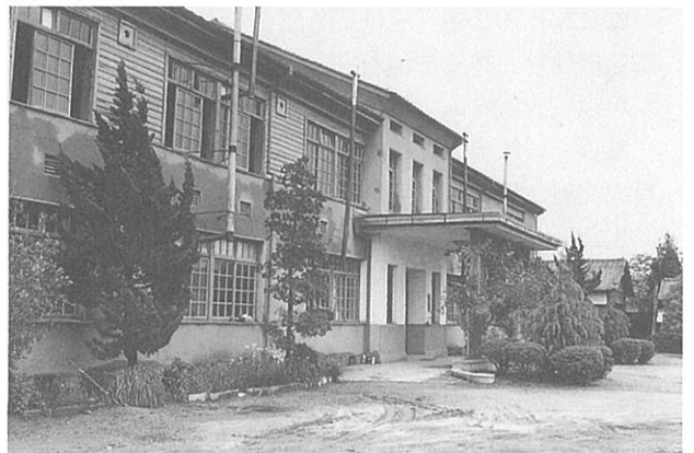
昭和24年に落成した本館