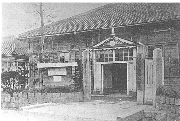
大正から昭和初期の本館