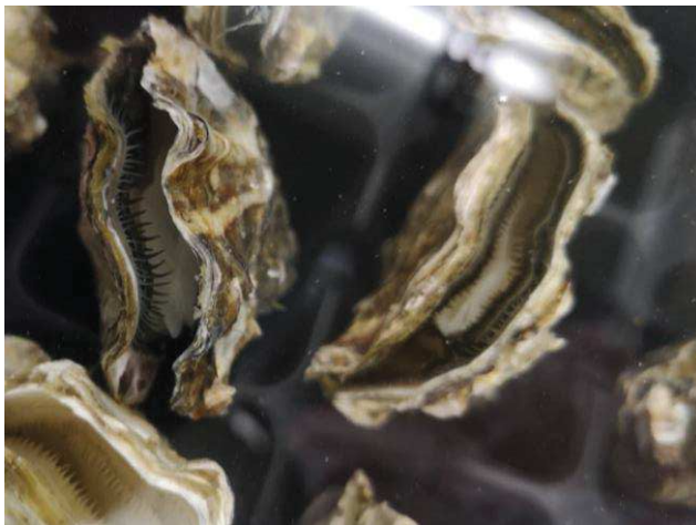
麻痺して貝柱が弛緩した状態のかき(MgCl 2 処理)